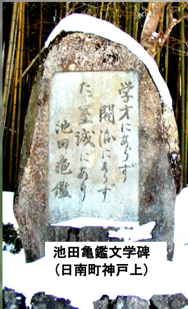
池田亀鑑文学碑 (日南町神戸上)